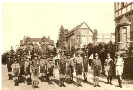
1935 - Troupe scout

Communiquer, encore échanger sont les objectifs principaux de notre association des Anciens. Ces derniers temps, les échanges se sont faits plus nombreux. L'initiative est issue le plus souvent d'un(e) ancien(ne) en quête de retisser des liens.